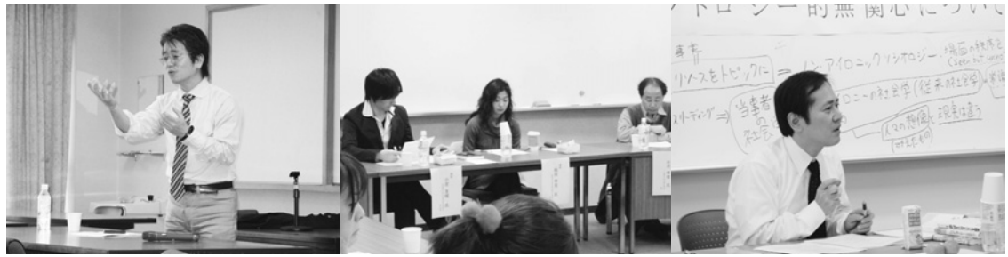
セミナーの様子(左から右に報告①,②,③)