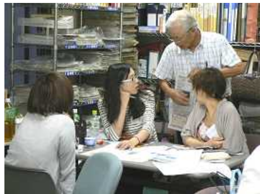
インターンシップ専門実習(国際社会)：H21年度

この学習・研究の展開から従来の修士論文とは異なるタイプの成果が出てきた場合、それを修了研究の一部、あるいはそれに替わるものとして認め、修了認定における評価対象とします。