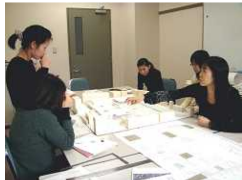
住環境設計特論（H20年度）

この学習・研究の展開から従来の修士論文とは異なるタイプの成果が出てきた場合、それを修了研究の一部、あるいはそれに替わるものとして認め、修了認定における評価対象とします。