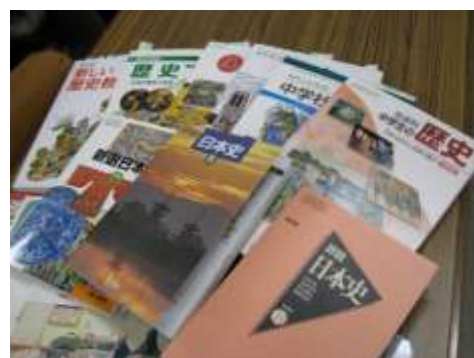
文化史総合演習（H20年度）