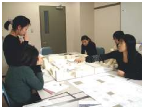
住環境設計特論（H20年度）

この学習・研究の展開から従来の修士論文とは異なるタイプの成果が出てきた場合、それを修了研究の一部、あるいはそれに替わるものとして認め、修了認定における評価対象とします。