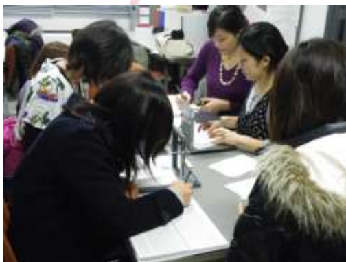
実践スキルゼミナール I（H20年度）