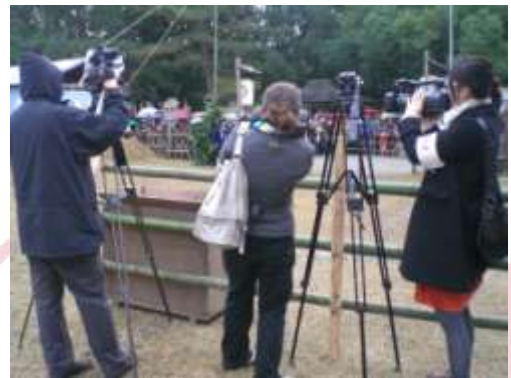
地域文化資源コンテンツ制作実習 B（H20年度）